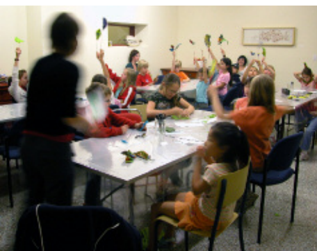
Atelier de feutrage dans le cadre du Camp artistique Herbi...

Afin d'offrir l'opportunité au grand public de s'initier aux diverses pratiques en métiers d'art, la MMAQ a mis sur pied une programmation exhaustive offrant des ateliers de sculpture, céramique, forge, textile, vannerie et reliure. Ces ateliers animés par des artisans créateurs passionnés ont été dispensés à deux cent soixante-sept participants.