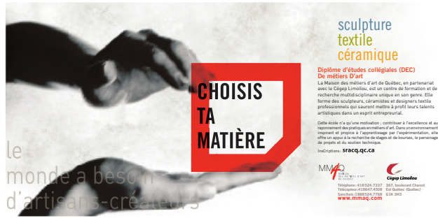
Publicité placée dans le réseau RTC en février 2009.

Nous nous sommes dotés d'outils structurants nos activités de promotion pour la réalisation de grilles d'analyse de situation, d'identification des publics cibles et d'une charte de communication. Une nouvelle ligne de campagne et une nouvelle grille graphique complètent notre stratégie promotionnelle.